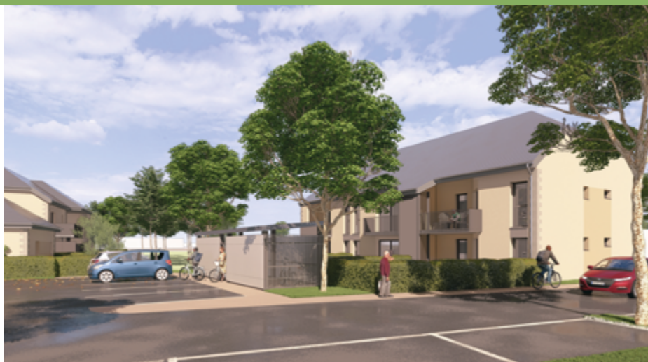
• Creusalis va construire 16 nouveaux logements collectifs à La Souterraine.